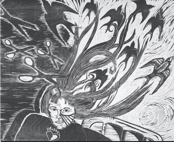
Free Your Mind , Tania Willard (BCS Cover, Spring 2017)

Peer reviewed multi-disciplinary multi-sensory BC.